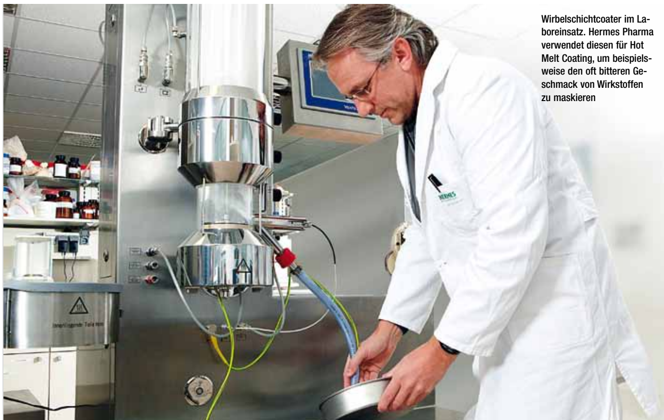
Wirbelschichtcoater im Laboreinsatz. Hermes Pharma verwendet diesen für Hot Melt Coating, um beispielsweise den oft bitteren Geschmack von Wirkstoffen zu maskieren

Tabletten schlucken ist nicht jedermanns Sache. Viele Arzneimittel sind oral einzunehmen, da dies als der günstigste, einfachste und sicherste Weg für die Selbstmedikation gilt. Konventionelle, feste orale Darreichungsformen haben jedoch ihre Nachteile: Eine aktuelle Studie belegt, dass über 50 % der Befragten in den USA und Deutschland Probleme mit der Einnahme von Tabletten und Kapseln haben. Oftmals sind diese zu groß zum Schlucken, bleiben im Hals stecken bzw. schmecken oder riechen unangenehm.