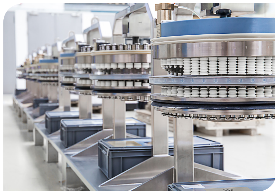
O uso de platôs de construção idêntica otimiza os valores de OEE e TCO de uma compressora.

Os platôs são limpos removendo a guia de deslizamento superior juntamente com os punções superiores e inferiores, enquanto a guia de deslizamento inferior permanece no compartimento de compressão. Para prevenir a entrada de poeira na área técnica da máquina durante a limpeza,