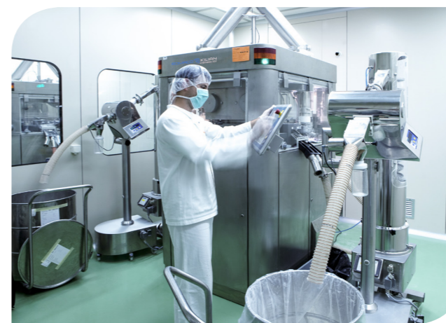
A Hemofarm reduz o tempo de limpeza utilizando platôs de construção idêntica, simplesmente trocados a cada final de lote.

uma tampa cega é instalada após a retirada do rotor de matrizes. A limpeza dos punções e matrizes, assim como de outras peças intercambiáveis, é realizada por uma lavadora industrial. O próprio platô é limpo manualmente na Hemofarm.