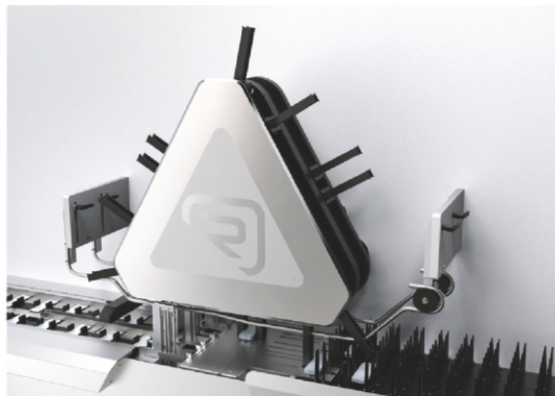
UNITÀ DI TRASFERIMENTO PILA DI UNITY 600 DI ROMACO NOACK

Con questa soluzione di trasferimento altamente automatizzata Romaco Noack permette il tracciamento continuo delle confezioni blister fin dal packaging primario.