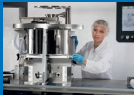
Schnelle Produktwechsel mit QuickFeed